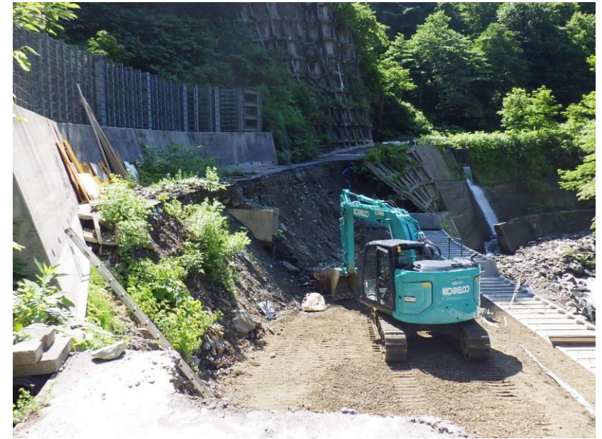
△被災箇所の現状（令和8年6月撮影）