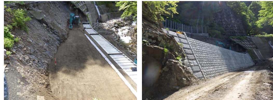
△大型ブロック積施工状況（令和8年6月撮影）