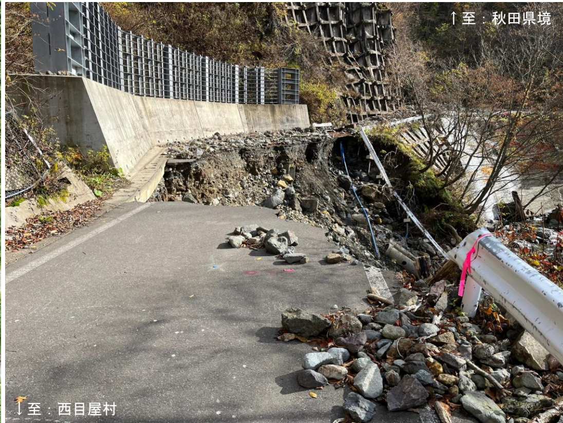
△被災時の状況（令和4年11月撮影） 「道路全体が崩落」