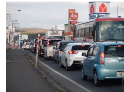
▲むつ市街地の渋滞状況