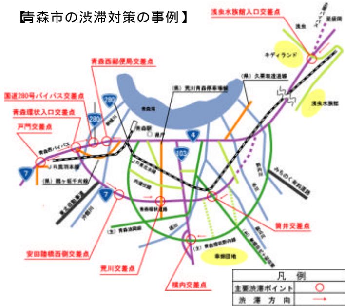
(青森県第3次渋滞対策プログラム)