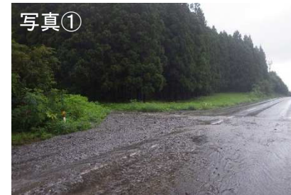
▲豪雨により路面に土砂が流出（平成28年8月17日）