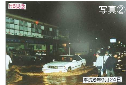
▲洪水により国道が浸水（平成6年9月24日）