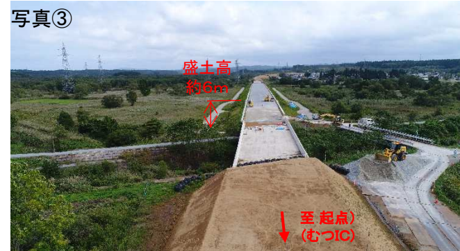
▲洪水浸水想定区域の盛土状況（令和元年8月撮影）