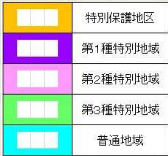
赤石溪流暗門の滝県立公園区域図 (赤石溪流付近)

確認してみましょう。 住まいや事業所の場所、工事現場が 公園区域に入っていないか？