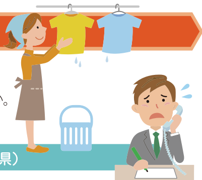
図表1 夫婦の役割分担の「理想」と「現実」（青森県）

青森県民が考える、夫婦の役割分担の「理想」はどのようなものでしょうか。そして、皆さんの家庭での役割分担はどのようになっていますか？