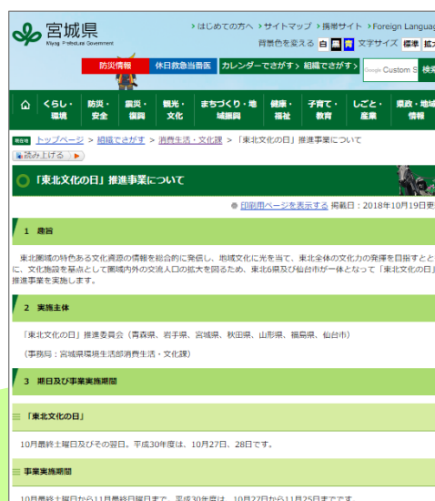
例：宮城県公式ウェブサイト

※「東北文化の日」として一体的に広報を行うことで、広域に効果的なPRができます。