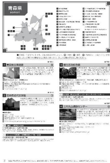
令和4年度ガイドブック

○東北6県と仙台市に配布する「東北文化の日」ガイドブックに、施設・イベント情報が掲載されます。