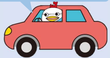
もったいない・あおもり県民運動 キャラクター「エコちゃん」

スマートムーブ通勤月間とは、10月1日～31日までの間、CO 2 排出削減に向け 5日以上「ノーマイカー通勤」 や「 エコドライブ通勤 」