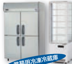
業務用冷凍冷蔵庫