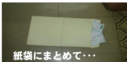
紙袋にまとめて・・・