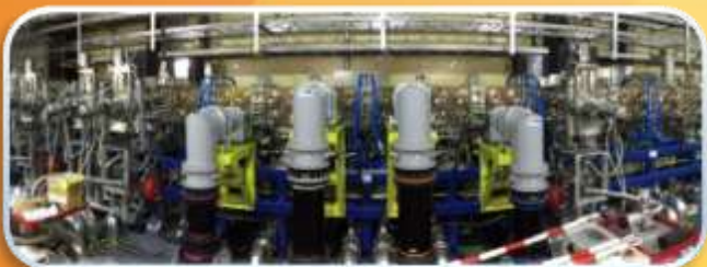
六ヶ所フュージョンエネルギー研究所に整備されている 高周波四重極加速器