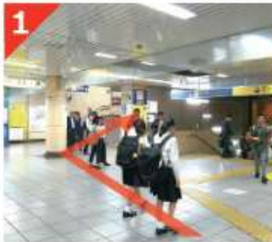
有楽町線・半蔵門線・南北線「永田町駅」3番出口が目的の出口です。