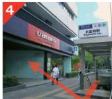
地上へと出てすぐ目の前のビルがビジョンセンター永田町です。