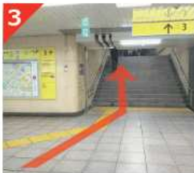
改札を出て右手へ進み、その先の階段を登ります。