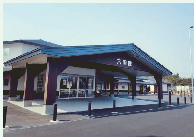
特産品販売施設整備事業(六ヶ所村)