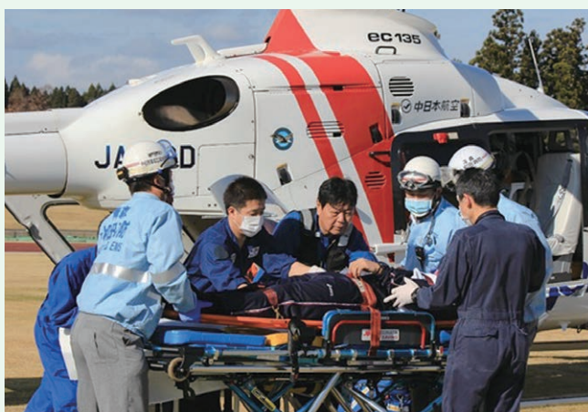
十和田市消防活動運営事業(十和田市)