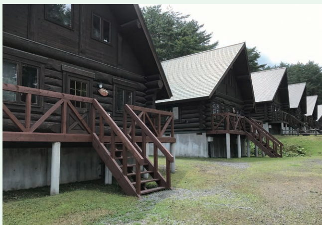
公共施設整備事業(ログハウスウッドデッキ修繕)(鱒ヶ沢町)