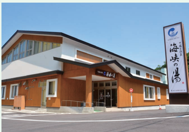
下風呂温泉施設整備事業(風間浦村)