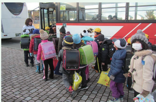
東通小・中学校通学バス運行委託事業(東通村)