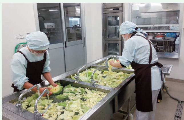
むつ市学校給食・環境整備提供事業(むつ市)