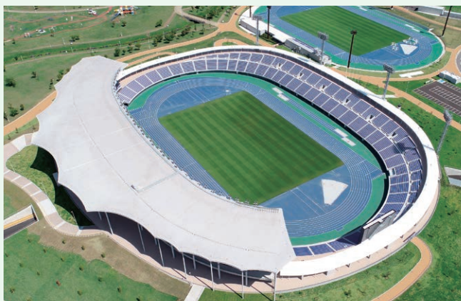
新青森県総合運動公園陸上競技場整備事業(青森県)