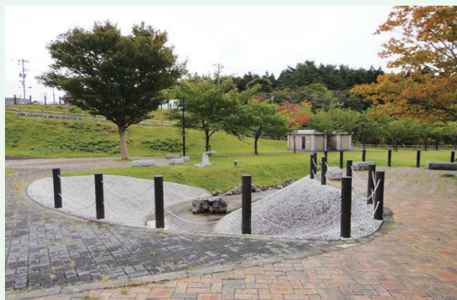
馬門川観光公園改修事業(六ヶ所村)