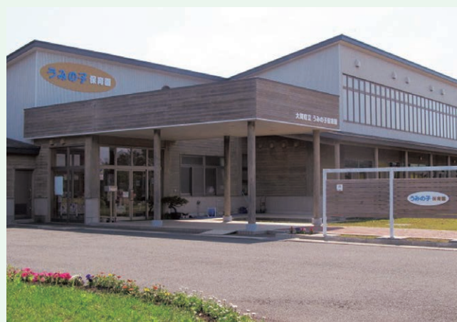
うみの子保育園運営委託事業(大間町)