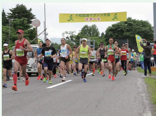
十和田湖マラソン大会(十和田市)