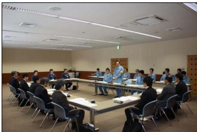
「原子力安全推進協議会の様子」 (平成 23 年 12 月 20 日に実施)