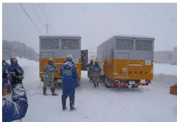
「視察した訓練の様子 （電源車による電源確保）」 （平成24年2月9日，東北電力(株)東通原子力発電所にて実施）