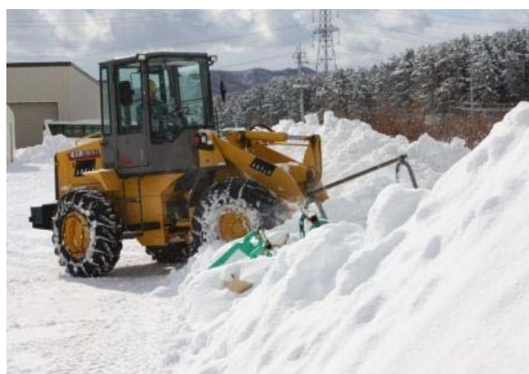
「視察した訓練の様子 （ホイールローダーによる瓦礫撤去）」 （平成24年2月9日，東北電力(株)東通原子力発電所にて実施）