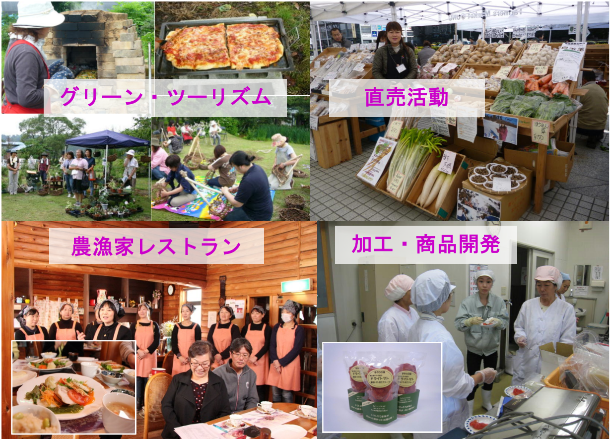
グリーン・ツーリズム