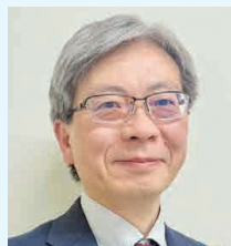
消費者庁消費者教育推進課 政策企画専門官