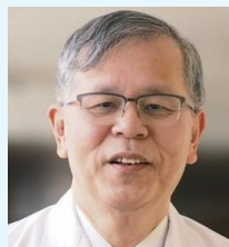
(公社)青森県医師会 副会長