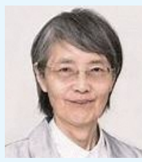
(一財)日本消費者協会理事長 東京経済大学名誉教授 弁護士