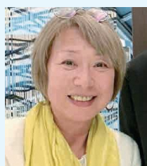
認定NPO法人環境市民 副代表理事