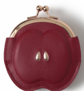
自社開発素材の強みを生かしたストーリー性のある商品を開発