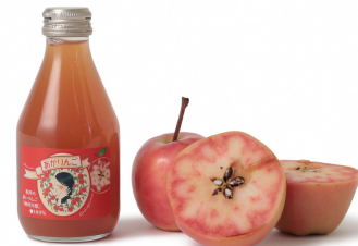
果肉まで赤い希少なりんごを使った商品のパッケージデザインを刷新しブランディング