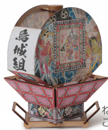
ねぶたの本格的な魅力を損なうことなく土産品として作りやすさにもこだわったキットの開発