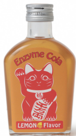
高品質・健康的な商品コンセプトを伝えるネーミングやパッケージを検討

県では、インバウンドの土産品購入需要に対応していくため、BEAMS JAPANと連携し、県内事業者の新商品開発や既存商品の改良・魅力向上を支援します！