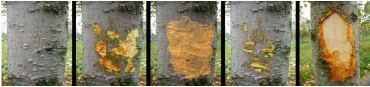
①削り取り前 ②削り取り完了 ③塗布完了後 削り取り不足 削り過ぎ