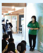
被災地語り部講話