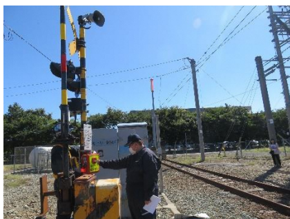
踏切支障報知装置の取扱い訓練