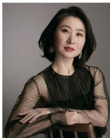
高実希子 Mikiko Koh

14歳で津軽三味線全国大会最年少優勝、その後3連覇(殿堂入り)。2007年17歳でメジャーデビュー。アメリカ、ヨーロッパ、北中南米、アジア各国など様々な国でコンサートツアーを実施し、その巧みな技術と持ち前のセンスで国内外問わず数多くのアーティストとコラボレーションを行う。近年は、ラジオDJや、NHK 民謡番組の放送作家としても活躍。また日本各地の民謡を現代の感覚で作編曲する「MIKAGE PROJECT」でワールドツアーを行い新たな音楽シーンを切り拓いている。