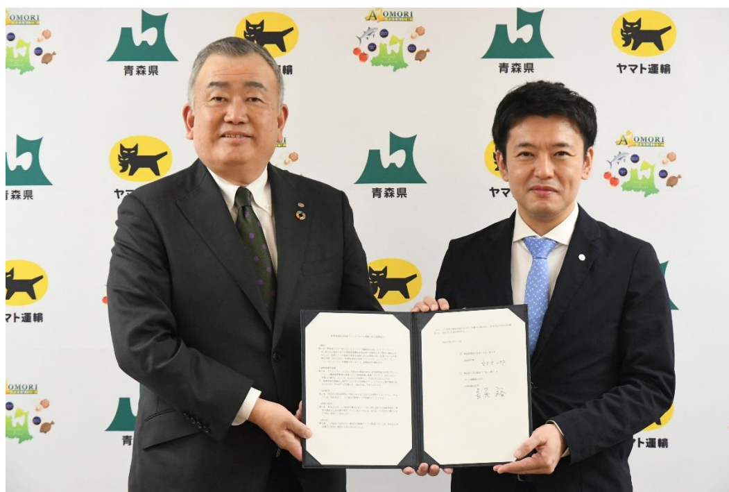
左) ヤマト運輸株式会社 代表取締役社長 長尾 裕 右) 青森県知事 宮下 宗一郎

2024年3月21日（木）11時45分より、青森県庁において「新青森県総合流通プラットフォーム構築に係る連携協定」締結式を行いました。