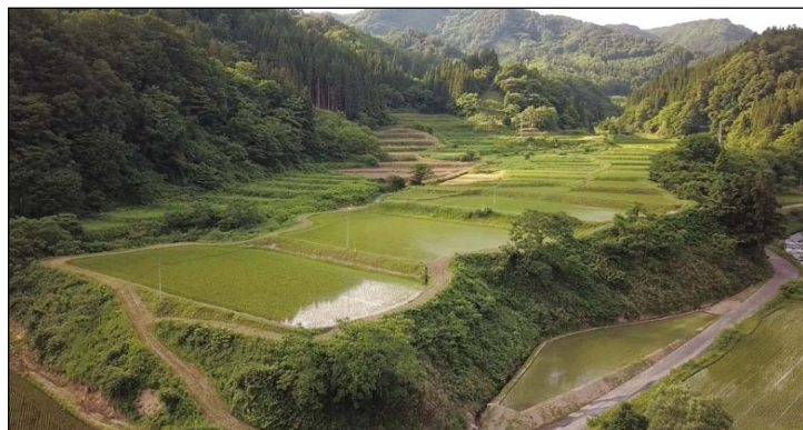
[大川原地区の棚田]