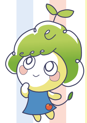
青森県エシカル消費 マスコットキャラクター エシル

青森会場 11月12日(日) カブセンター大野店 (青森市大野前田73-6) 1回目：11時～12時 2回目：14時～15時