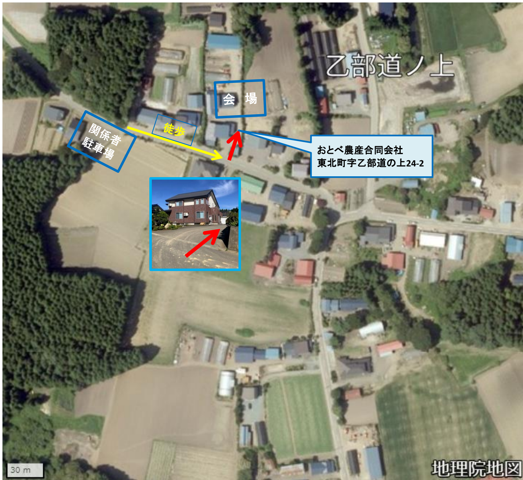
※地理院地図 Vector(写真)を加工して作成