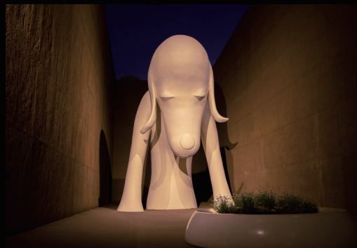
奈良美智《あおり犬》(2005) © Yoshitomo Nara