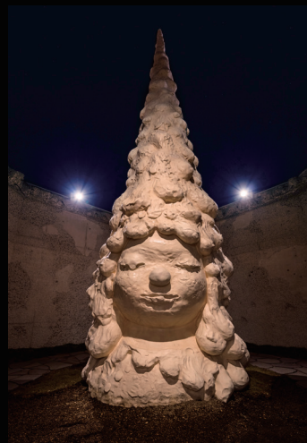
奈良美智《Miss Forest / 森の子》(2016) © Yoshitomo Nara