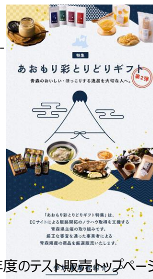
昨年度のテスト販売トップページ

テスト販売結果を踏まえたフォローアップ 各社からの今後のECサイト運用に関する質疑応答