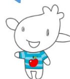
青森空港キャラクター「ひこりん」