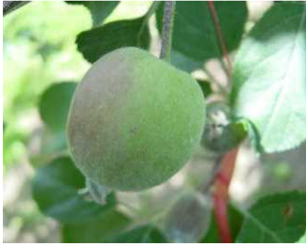
降ひょう時の傷の大きさ約2mm