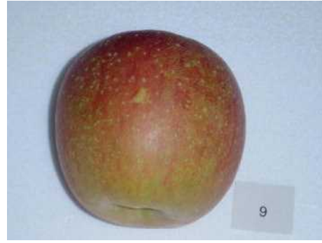
収穫時に傷はほとんど目立たない