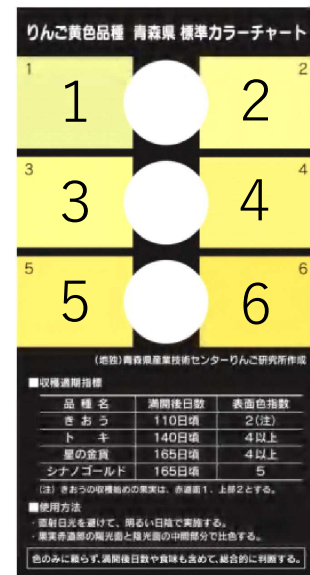
▲標準カラーチャート