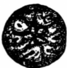
4 : 30%でんぷん消失