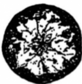
3 : 50%でんぷん消失