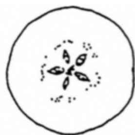
0 : 100%でんぷん消失

日本なしの地色用カラーチャートを使用し、果実の尻の部分のコルク層を薄く剥ぎ、変色しないうちに比色 (図参照)