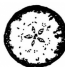
2 : 70%でんぷん消失