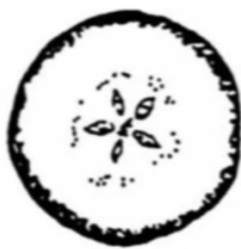
1 : 90%でんぷん消失