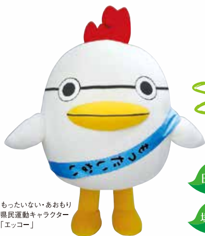
もったいない・あおもり 県民運動キャラクター 「エココ」

ごみ排出量やリサイクル率の改善、様々な影響が懸念される地球温暖化問題。これらの課題解決に向け推進してきた「もったいない・あおもり県民運動」は今年で10周年を迎えました。今一度、地球とあおもりの未来のために私たち一人ひとりができることを考え、「もったいない」を再認識しませんか？