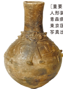
〔重要文化財〕 人形裝飾付壺型土器 青森県弘前市十腰内出土 東京国立博物館所蔵

開館20周年を記念し、アートと食 を楽しめるイベントを開催。トーク ショーや美術館ツアー、クラフト ブースも。