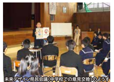
未来デザイン県民会議(中学校での意見交換)のようす