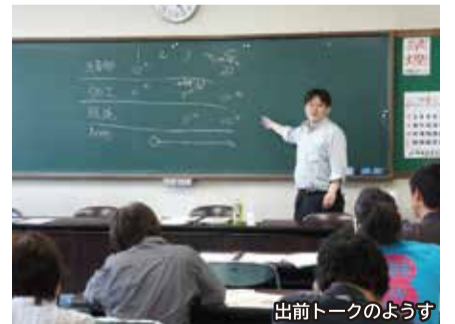
出前トークのようす