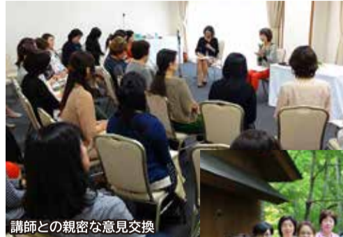
講師との親密な意見交換