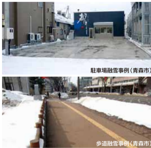
駐車場融雪事例(青森市)

県では、地域の熱エネルギーを活用することで、雪国の暮らしをより高効率で快適にする取組を推進しています。