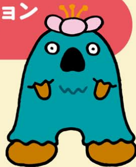
青森DCマスコットキャラクター「いくべ」