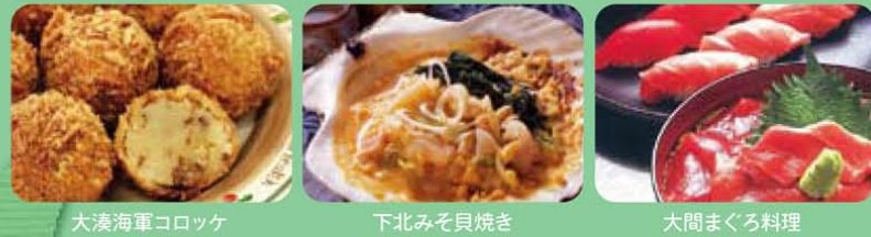
大湊海軍コロッケ