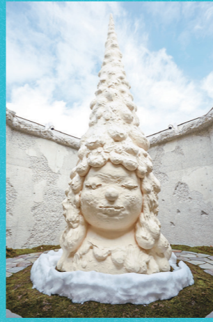
Miss Forest/森の子 ©Yoshitomo Nara