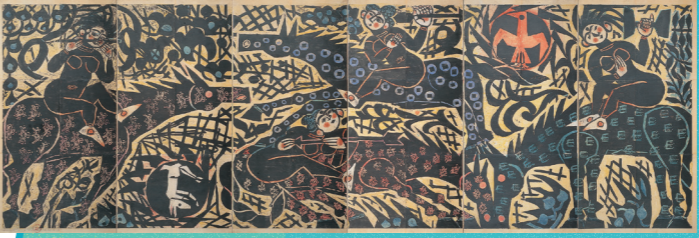
「花矢の柵」棟方志功 1961年 木版、彩色・紙 215.0×688.0cm