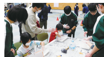
中学生の企画で学んで遊ぼう！の様子(令和6年度)

学んで、動いて、寒さをふきとばせ！子どもたちが主役になって学びを深めるイベントです。ぜひご家族でお越しください。