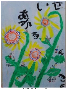
折館 朱 むつ市立第三田名部小学校(1年)