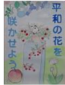
新岡 真那葉 つがる市立木造中学校(2年)