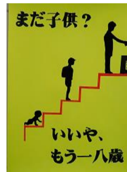
長内 駿 青森県立弘前実業高等学校(3年)