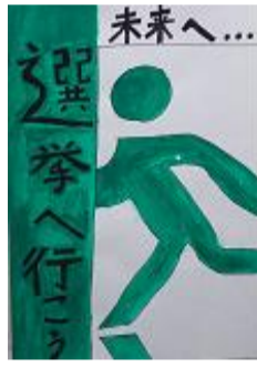
土屋 諒祐 青森市立甲田小学校(6年)