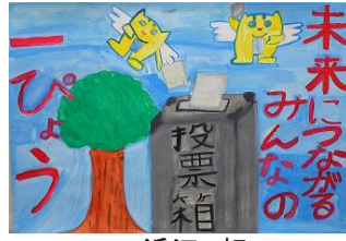
近江 虹 むつ市立正津川小学校(4年)