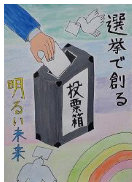
新町 紅里 八戸市立白鷗小学校(6年)