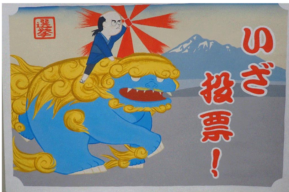
江良 美妃 つがる市立木造中学校(2年)