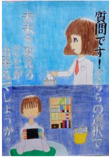
間 虹好 八戸市立大館中学校(1年)