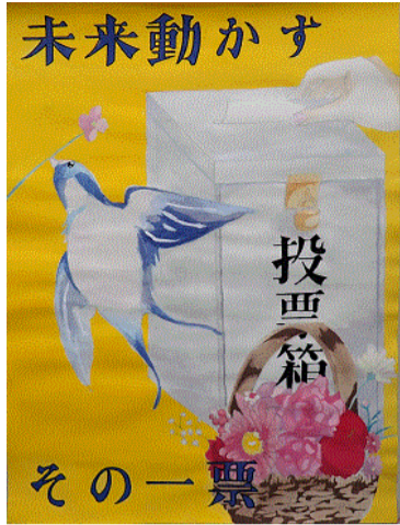
向井 美結 八戸市立白山台中学校(2年)