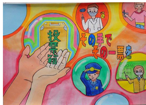
瀧下 倅未 青森市立横内小学校(6年)