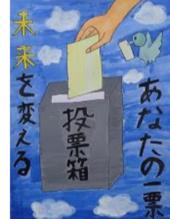
城下 初音 八戸市立白鷗小学校(6年)