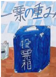
西谷 ののは 青森市立甲田小学校(6年)