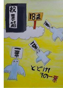
堰合 健介 八戸市立白鷗小学校(6年)