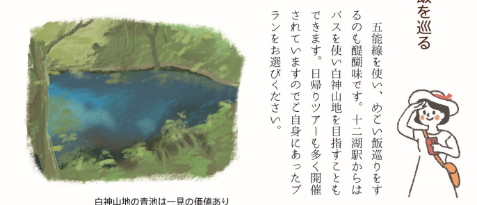
白神山地の青池は一見の価値あり

「奥津軽のめごい飯」とは地域の住民に愛され、地域を象徴するような味や食文化、未来に残したい郷土料理、大衆食堂、地元銘菓で、地域に親しまれている味です。日本海と湖に囲まれた鯉ヶ沢・深浦地域の西海岸はしじみ、もずく、ヒラメといった海産物が豊富に獲れ、めごい飯の宝庫です。また、川魚にも恵まれ、イトウや鮎を扱う店も見られます。世界遺産・白神山地を源流に持つ赤石川の清流水で養殖されたイトウ。川のトロとも呼ばれ、淡白でクセのない口当たりは、どのような料理、お酒とも相性抜群です。西海岸に足を運んだ際は、海産物、川魚などの地域ならではの素材を使った郷土料理をご堪能ください。