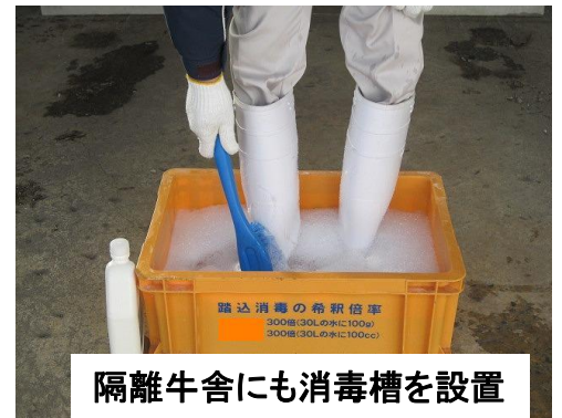
隔離牛舎にも消毒槽を設置