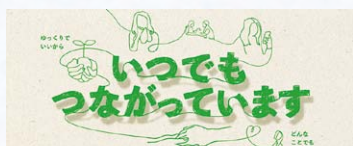
「こころ」を繋いでください。 生きていくための包括的支援に関する普及啓発