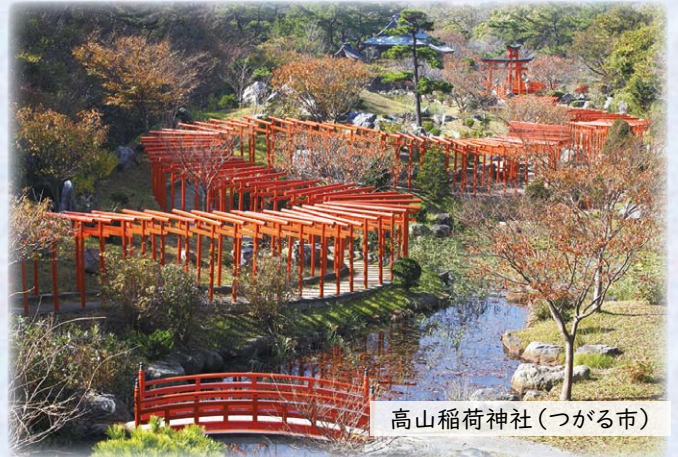
高山稲荷神社 (つがる市)