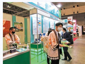
デジタルものづくりの誘致活動(首都圏大規模展示会)