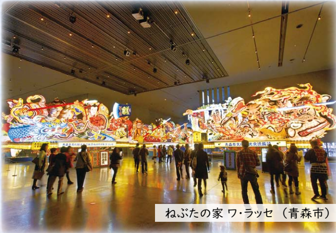
ねぶたの家ワ・ラッセ (青森市)