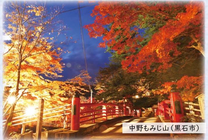
中野もみじ山 (黒石市)