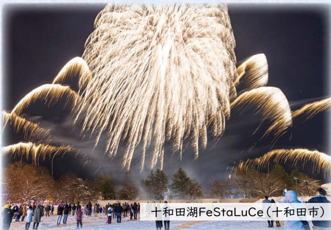
十和田湖FeStaLuCe (十和田市)