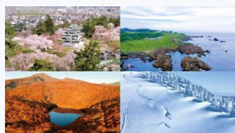
四季の自然美をドローンで撮影しPR