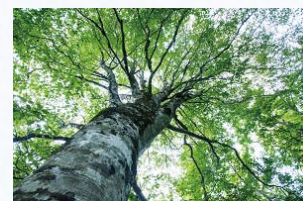
ブナの巨木(白神山地)