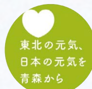
青森県震災復興シンボルマーク

※三陸ジオパーク：青森県八戸市から岩手県沿岸を縦断して宮城県気仙沼市まで続くジオパーク。平成25年9月に日本ジオパークとして認定されました。三陸ジオパークの活動は、東日本大震災からの復興にもつながるとともに、津波災害の経験や教訓を伝えることも目的としています。