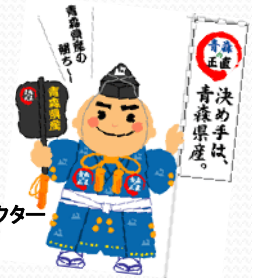
青森県産PRキャラクター “決め手くん”

ふるさと納税制度についての詳しいご案内はこちらへ・・・ <結集!! 青森力 ふるさと青森応援サイト>