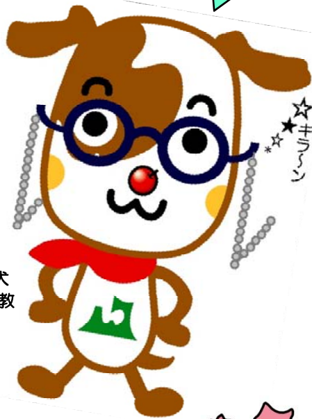
ふるさと納税犬 ハコくん助教