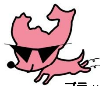
ブラックムッチャン