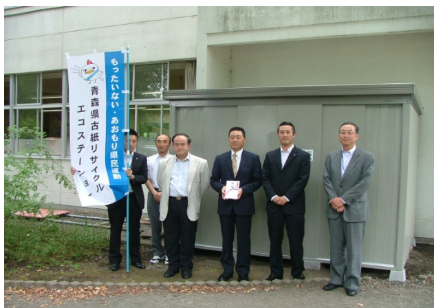
《十和田市立北園小学校》