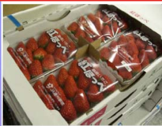
静岡県産「紅ほっぺ」(JA遠州夢咲)も入荷中。果皮が鮮やかな赤、さらに果肉の中まで赤いのが特徴です。

12月は「いちご」の季節。だって街のあっちから「おジャムベリー〜シングルベリー」と聞こえてきます...。えっ、聞き間違い!...タラ〜タラララ〜。それはさておき12月の「いちご」は引張りだこ(タコじゃありませんけど...)。クリスマスケーキに真っ赤な「いちご」は欠かせません。このため例年、価格は高く「とちおとめ」「あまおう」等の各県自慢の品種が入荷します。今年も〜と行きたい所でしたが今年の結果は...。景気が後退〜ケーキも後退(大ささ)〜「いちご」の数が減少〜数量が割れず価格下落〜厳しい状態へ...。年明け後も、昨年の9割の価格で...産地ではちょっと不満げ...。この局面の打開には産地と市場が一掃になった販売努力が必要...合い言葉は「一致、GO」です!