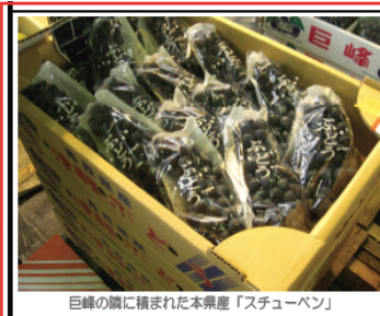
巨峰の隣に横まれた本県産「スチューベン」

第2号以降は、あくまで「気軽に 楽しく 身近に 東京市場の動きを感じられる」ようにとの配慮から(?) カラーを多用し、「!」や「?」や「( )」などを散りばめパワーアップ! それでも足りなくて、創刊号から5か月後となる第9号(平成18年11月17日発行)にはダジャレも初登場。スチューベンの記事でした。「そったらこと、あたりまえだ!、みんなして、スッチューベンな!」と言われそうです。は難度が高いですねえ。その後は行けるとこまで突き進むかのように連射します。いくつかを振り返ってみましょう。