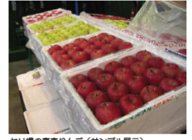
セリ場の青森りんご (サンプル展示)

春先から続いている低温・日照不足の影響から本来この時期の主役であるメロンやすいかの入荷が少なく、また、低温により動きも鈍い状態。競合果実が少ない状況から食味のよい青森りんごの販売が好調となっています。特に王林は、一時期の低迷を抜け出し、6月中旬の平均単価が前年を上回るkg当たり317円と前年より好調な動きとなっています。