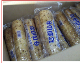
まっ、本県産「ながいも」に比較して、多少肌が黒い気味ですが、粉れもない茨城県産の「ながいも」です。