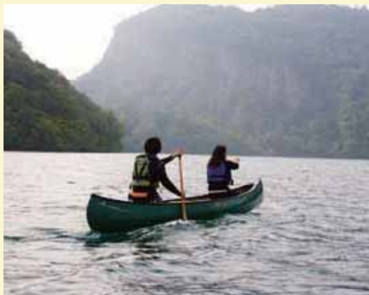
十和田湖カヌー体験