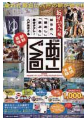
朝市と早朝銭湯を巡るタクシーツアー