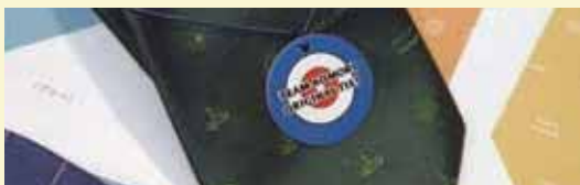
カーリングネクタイ