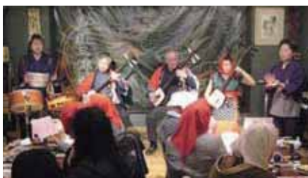
津軽三味線居酒屋ライブ