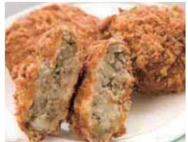
大湊海軍コロッケ