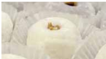
アビオスを原料とした餅