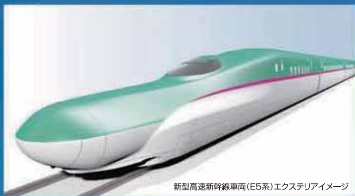
新型高速新幹線車両(E5系)エクステリアイメージ