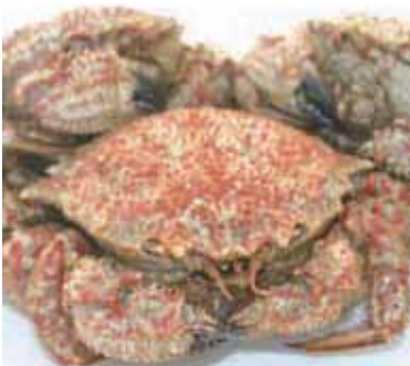
トゲクリガニ(七子八珍)