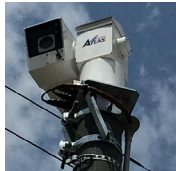
上北地域整備部(野辺地川)等で設置 超高感度ハイビジョンカメラ搭載高精細監視 カメラシステム(多摩川精機(株))