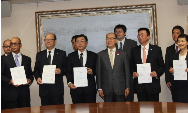
新規認定者に対する 認定書交付式