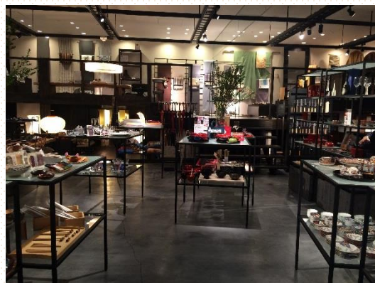
↑ 昨年度のテスト販売「青森展」の様子