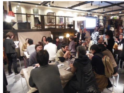
↑ 消費者との交流イベントの様子