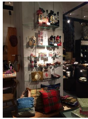
← テスト販売の様子