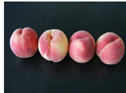
写真 「まどか」の果実