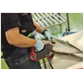
非破壊計測によるブリの脂質測定

食品加工部門では、県産農林水産物を生かした加工品の研究開発のほか、加工グループ、企業に対する技術普及や指導などを行っています。