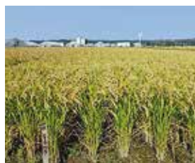
水稲新品種「はれわたり」

農林部門では、水稲、ながいも、りんご、きのこなどの新品種の育成、肉用牛の基幹種雄牛や特産地鶏など家畜の改良、農林産物の高品質・安定生産や森林の管理技術の研究などを行っています。