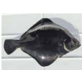
陸上養殖したカレイの仲間「マツカワ」

水産部門では、海や川・湖における漁場環境、資源管理、漁業管理技術、栽培漁業・養殖技術の調査・研究などを行っています。