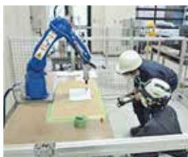
6種類のロボット操作を体験できる試験室

工業部門では、県内企業が抱える技術的な課題の解決に向けた技術相談、機器貸出し、依頼試験等による支援に加え、ものづくりの各分野における研究開発などを行っています。